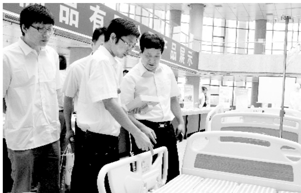
↑近年来,圣光集团以精益求精的管理、优质的产品、周到的服务、合理的价格以及便捷的查询订购配送模式赢得了客户的信赖。图为在近日举办的第24届中原医疗器械展览会上,客户们在圣光集团医疗器械展台前选购产品。